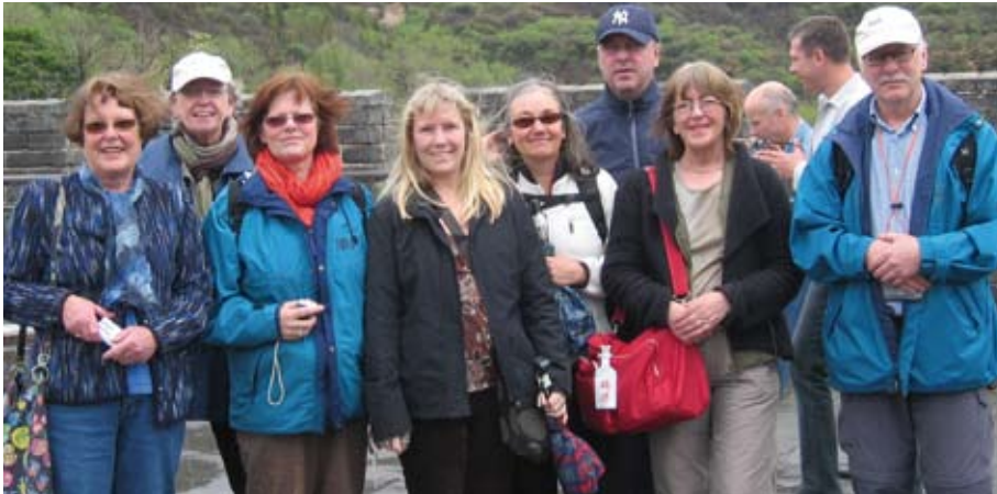
Motala BUP avsätter mycket pengar till kompetensutveckling. Här är gruppen på studieresa i Kina.

centrum. Vår mottagning är lätt att nå även från andra orter då länsbussarna stannar i närheten. Vi tyckte att vi kom närmare befolkningen här.