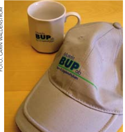
Motala BUP har tagit fram profilprodukter som muggar och kepsar för att göra reklam för sin verksamhet.