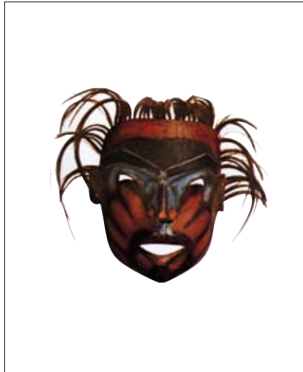
Kwakiutl mask, British Columbia